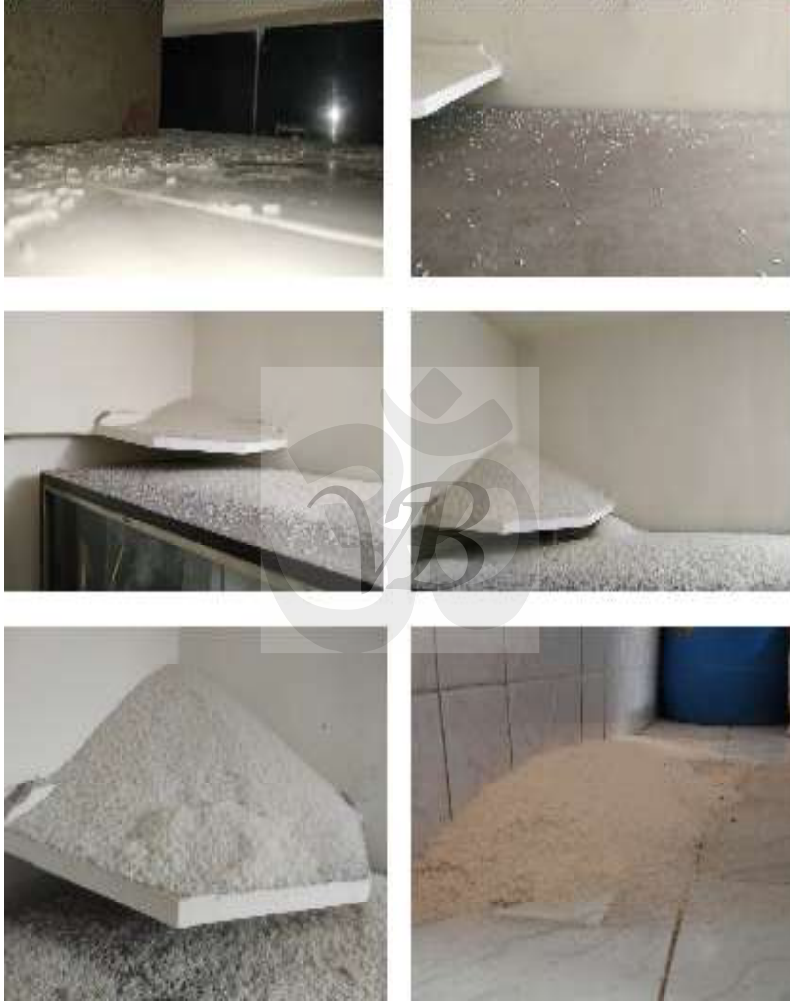
अदृश्य सृष्टीतून येणारे तांदूळ